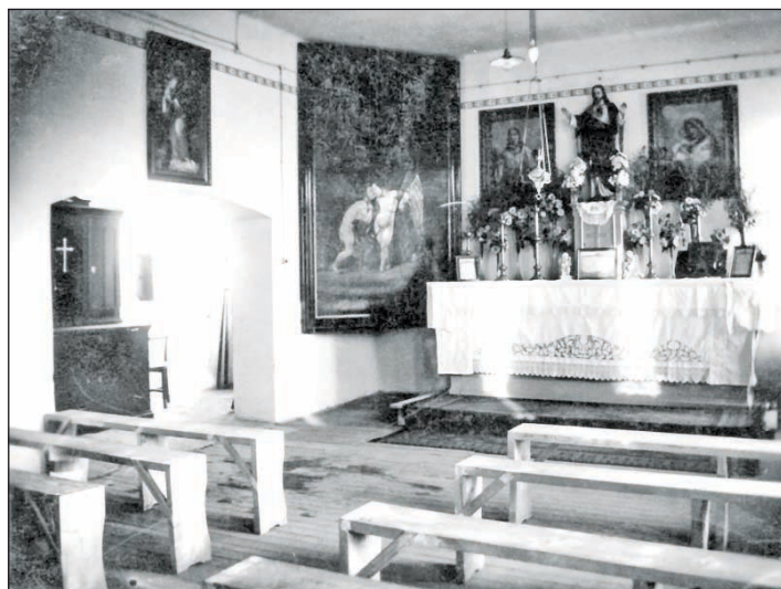
1929-ben az ún. Thuróczy-féle nagyobb lakásban lett otthonra a káplánság

A hívek adományai tették lehetővé, hogy az akkori és mostani Rákóczi út és Szent Imre (most Alkotmány utca) sarkán megvehetette a káplánság azt a 736 négyszögölnyi telket, amire plébániát és templomépületet is tervezhettek.