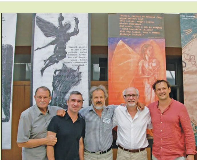
A Tokaji Íróttáborban jártak a vásárosnaményi kiadású Partium folyóirat szerkesztői.