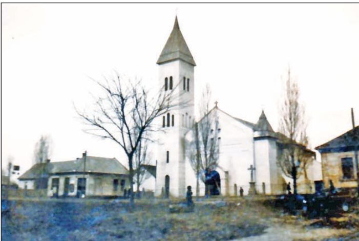
Utcakép: Vásárosnamény 1936.

Az építkezés ideje alatt is folyt az adománygyűjtés, de sokkal jelentősebb volt az az élőmunka, amit a hívek a templomépítés mindennapjaiban elvégeztek. Aki tehette, fuvarát vállalt, akinek erre nem volt módja, segédmunkával szolgálta a „szent ügyet”. Öt hónap megfeszített építőmunka eredményeként, 35.000 pengő összköltségből, a teljes belső berendezéssel, a maga 26 méter magas tornyával együtt, elkészült a vásárosnaményi katolikus templom.