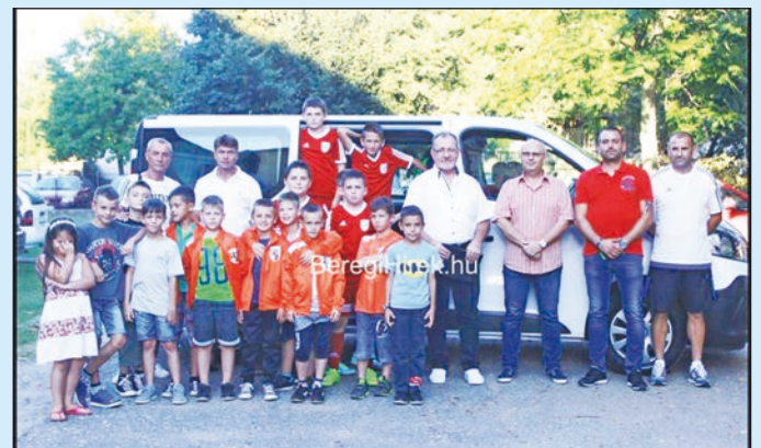
A vásárosnaményi Diák Sportegyesület mikrobuszt és felszereléseket vásárolhatott a Tao-program keretében nyert 16,5 millió forintból, amit saját forrásból egészítettek ki.