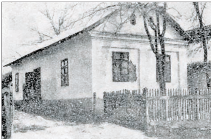
Kápolna és paplak kívülről