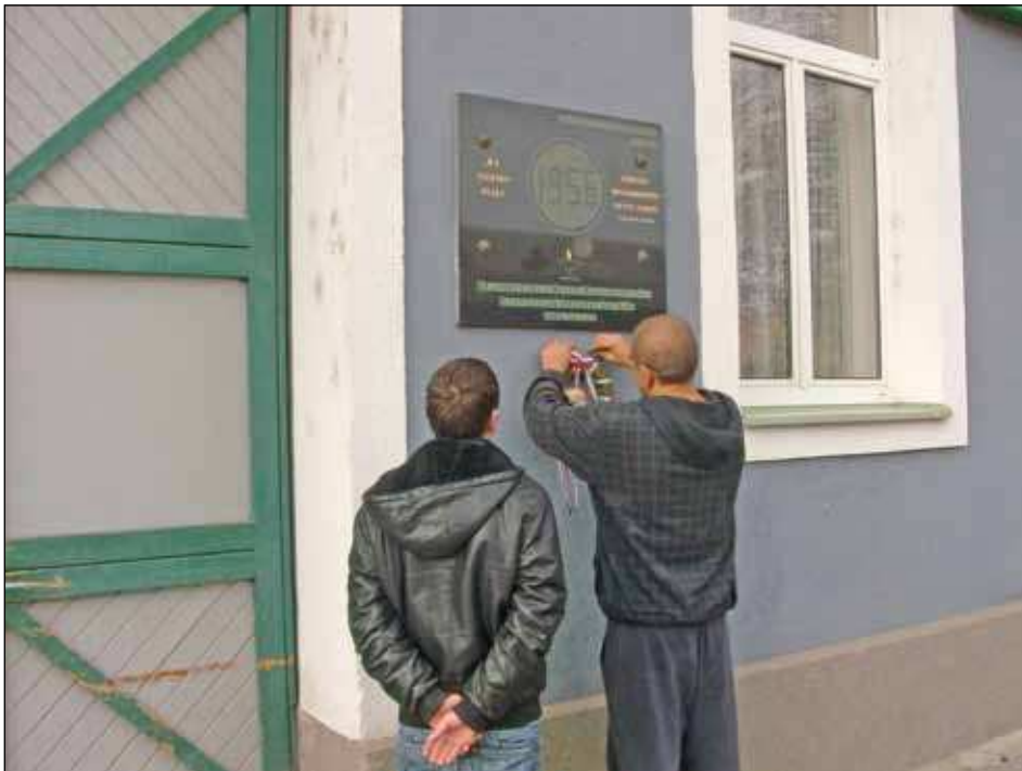
A Kelet-Magyarországi Szabadelvű Protestáns Kör örökösei koszorúztak október 23-án a vásárosnaményi '56-os emléktáblánál

Ezúton is köszönjük mindenkinek, aki személyes jelenlétével megtisztelte rendezvényünket, ezáltal hozzájárult a kegyelettel teli megemlékezésünkhöz.