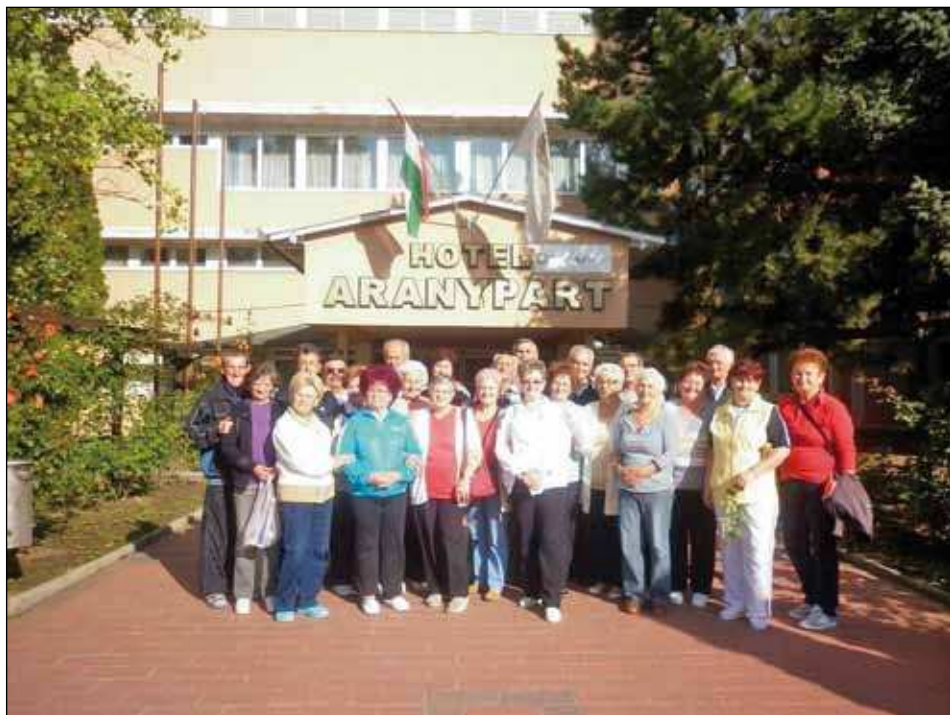
Siófokon az Erzsébet Szálló előtt

Az ételek gazdag választékán kívül az is nagyszerű volt, hogy kivételes bánásmódban részesültünk: mindig ugyanazon a helyen az étkeztünk, az éppen születésnapját ünneplő társunkat pedig tortával köszöntötték a szálloda dolgozói.