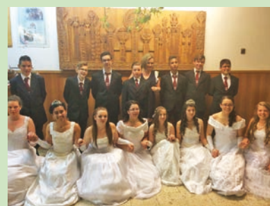
A fotón a 8. osztály táncosai, akik keringőjükkel nyitották meg a mulatságot.