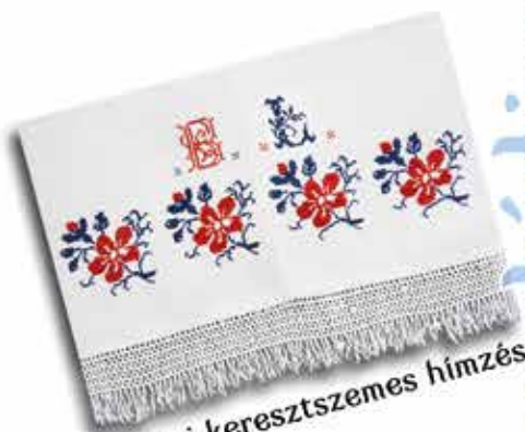
Beregi keresztsemes hímzés