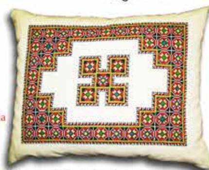
Beregi háziipari keresztsemes hímzés