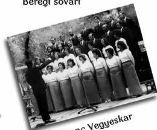
Liszt Ferenc Vegyeskar