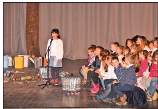
Verssel a tisztaságért

környezetbe, ahol Hamupipókének és több meseszereplőnek segítettek megtisztítani Meseországot a mindent elborító hulladék-halmoktól. A gyermekek aktívan részt vettek a hulladékok szelektív szétválogatásában is a versmondáson kívül. A megtisztult Meseország tünderei és királya pedig minden gyermeket „Meseország díszpolgára” címmel jutalmazott.