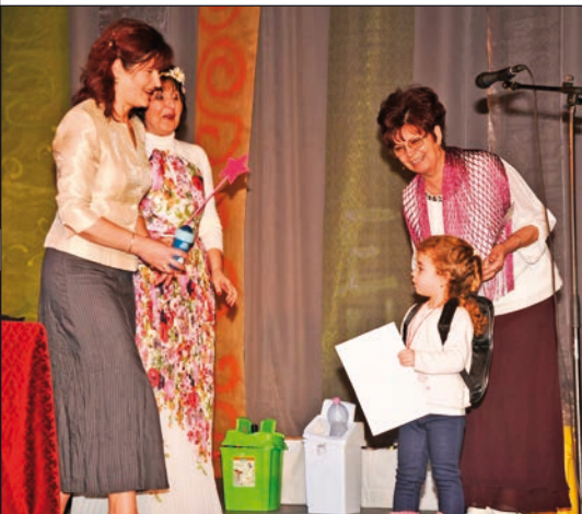
A Tündérek Tanácsa jutalmaz