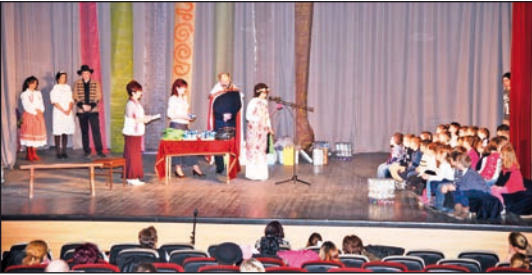
Minden jó, ha jó a vége