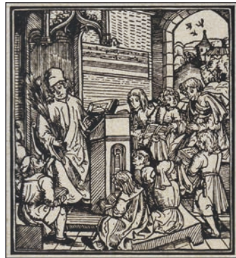
Iskola a középkorban

Az Urálon inneni területeken török népekkel, csuvasokkal, tatárokkal, baskírokkal éltek