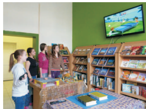
A gyerekek élvezik a játékokat a Könyvtárban

Az, hogy a gyerekek számítógépes játékokkal töltik idejük nagy részét, sokak előtt ismeretes. Ennek következtében rengeteget ülnek a gép előtt, ezzel sokat ártnak saját egészségüknek. Mivel a több órás ücsörgés gátolja a jó keringést, a Nintendo kifejlesztett egy olyan videójáték-konzolt, és hozzá játékokat, amely különböző mozgásformák utánzását teszi lehetővé. Különleges tulajdonsága, hogy vezeték nélküli távirányító a játék vezérlője. Használatakor a televízióval szemben állva ezt az eszközt kézben kell tartani és a játék eseményének megfelelően 3D-s mozgásokat lehet vele végezni. A játékok sokféleségét jelzi, hogy a kerékpározás, asztalitenisz, tenisz, tánc és aerobic jellegű mozgások mellett megtalálható a klasszikusnak mondható egyik legrégebbi játék is, a Super Mario. Kicsiknek és nagyoknak egyaránt ajánljuk, próbálja ki, aki mozogva szeretne kikapcsolódn!