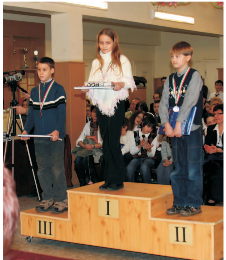
A legjobbakat éremmel és különböző ajándékokkal is jutalmazták a verseny zárórendezvényén.

(A támogatók névsorát az áprilisi számunkban közöljük.)