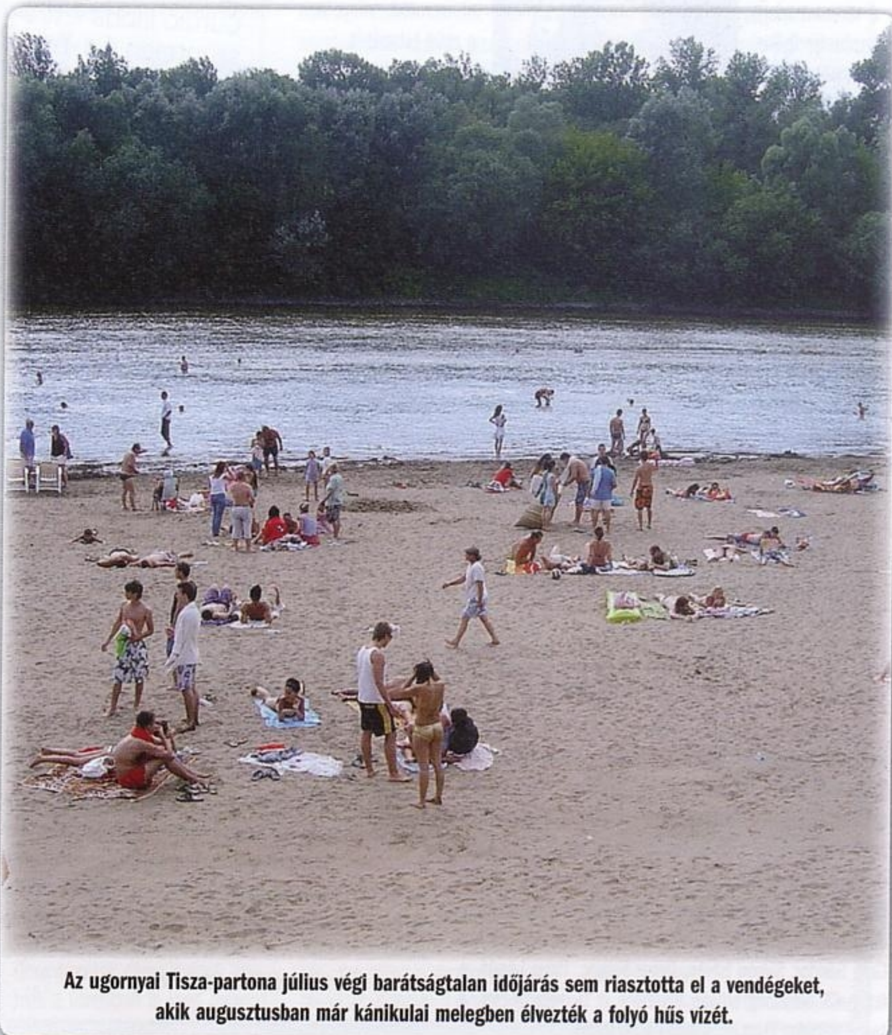
Az ugorlyai Tisza-partona július végi barátságatlan időjárás sem riasztotta el a vendégeket, akik augusztusban már kánikulai melegben élvezték a folyó hűs vizét.

Köszönjük megtisztelő figyelmüket. Továbbra is várjuk észrevételeiket, a 107, illetve a 06 45 470-422 telefonszámon, vagy személyesen.