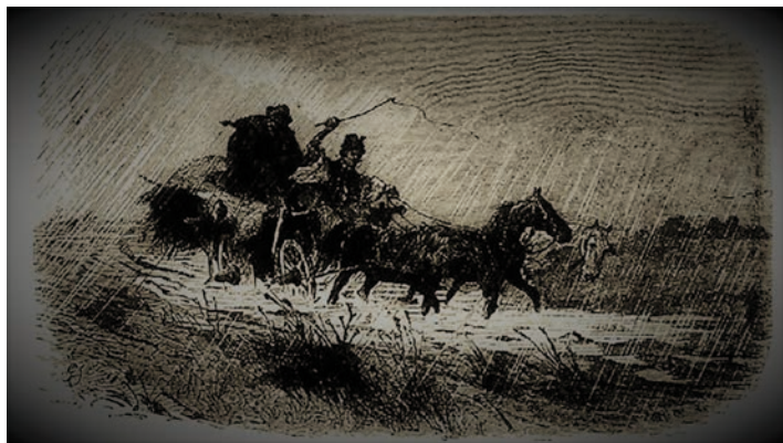
Utazás Magyarországon Kölcsey korában

„Kölcsey Ferenc számára igen fontos volt a magyar nyelv pontos használata. Az eredetiségre pedig külön hangsúlyt fektetett, így utazásai során nem egyszer ütközött némi ellenállásba.