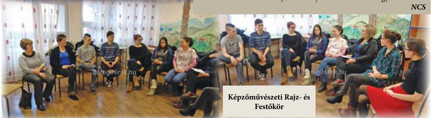
Képzőművészeti Rajz- és Festőkör