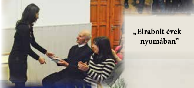
„Elrabolt évek nyomában”