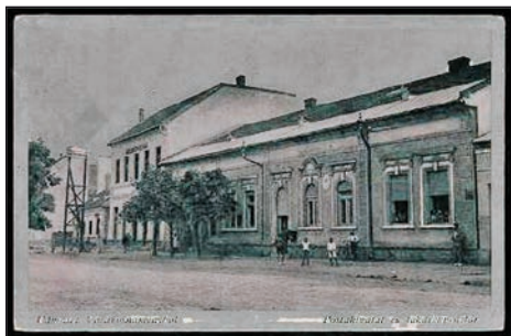
Utcakép a múlt század közepén

Egy – a képviselő testület által meghatározott – időponttól minden újszülött