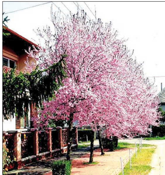
Tavaszi a Veres Péter utcában

A szorgos és szakszerű közterület-gondozás meggyezerte elismertté tette településünket. A „TISZTA ÉS VIRÁGOS TE-