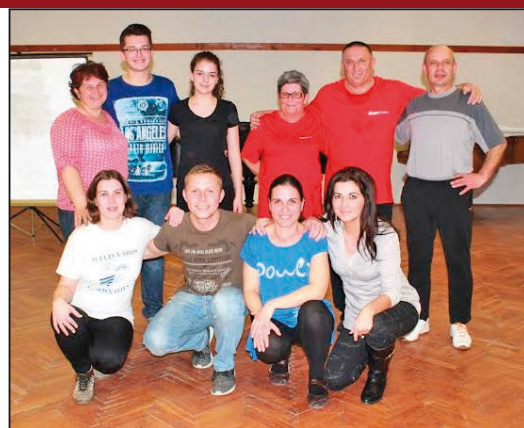
A csoport tagjai