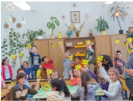
Vendégségben a vitkai óvodások a vitkai kisiskolásoknál