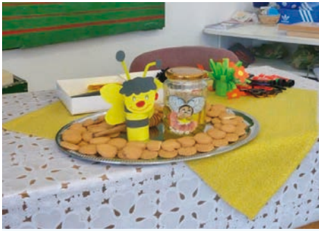
A jó hangulatú délutánon méhecskét készítették, és mézet kóstolhattak együtt ovisok és sulisok