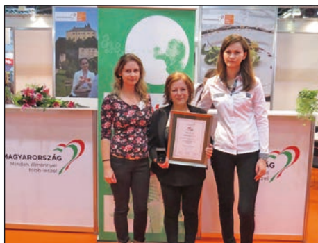
Budapesti Utazási Kiállítás

Kérdés, hogy ez dicsőség-e vagy sem, de tény, hogy Szabolcs-Szatmár-Bereg megyében ma Vásárosnamény az egyetlen település, ahol egész évben nyitva tartó Tourinform iroda működik. Ez azért fontos, mert az ide érkező turista csak itt kaphat teljes körű, naprakész, átfogó turisztikai információkat látóvalókról, szálláshelyekről, étkezési lehetőségekről, programokról. A turistainformáció gyűjtése és adása mellett irodánk foglalkozik a város turizmus-marketingjével és nagyobb rendezvények szervezésével is. Így ebben az évben már negyedik alkalommal láttuk el a Zoárd-napi Sokadalom főszerzői tevékenységét. Folyamatosan adunk be pályázatokat, ennek köszönhetően egyre több szakmai díjat, elismerést is sikerül begyűjtenünk: