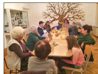
A vitkai versbarátok