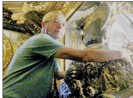
Átölelte Szent Jakab szobrát

számukra jó életet. A letett kövek azt szimbolizálják, hogy a zarándok a megbánt bűneit teszi le a Megváltó keresztje alá. Én is lelki megkönnyebbülést éreztem ott, miközben a zarándokok imáját elmormoltam: „Uram, az igyekezetem szimbóluma, a zarándokúton, legyen ez a kő...”.