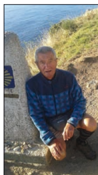
Szent Jakab útján