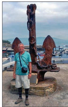
A világ végén Finisában