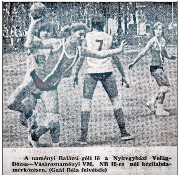
A naményi Balácsi gólt lő a Nyíregyházi Volán-Dózsa—Vásárosnaményi VM, NB II-es női kézilabdamezőn.

Jelentős helyi összefogással, 1960 nyarán, a Kraszna-töltés mellett ( most a Szilva-fürdő területe ) 40×20 méteres, sala-