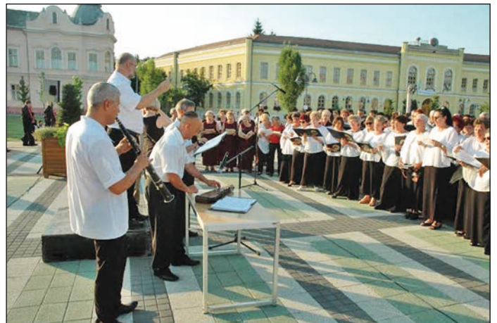
Összkar tárogató kísérettel

A rendezvényen a kórus megkapta Hajdúböszörmény város különdíját.