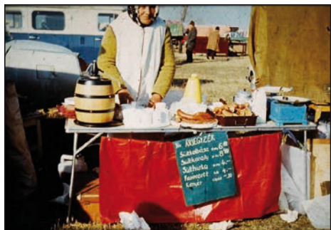
Taberna, 1977.

6 éves lehettem, amikor édesanyámmal először kimentem a vásárba. Olyan kicsike