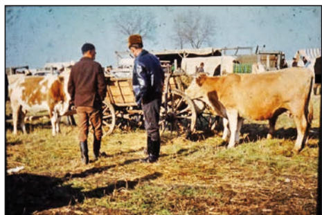
Állatvásár, 1969.

10 éves koromban aztán nagy vásározó lett belőlem, mivelhogy én magam is árultam a vásárban. Ekkor már, pontosabban 1938-tól a vásárokat a Varsányi út baloldalán, a vasúton túli részen tartották, az ún. Vásárterén, ahol a legtöbb árus sátorban árulta a