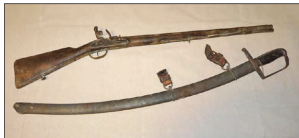
Az Eötvös-kúriából előkerült 1824 M huszárszablya és 1798 M franciakovás puska

Eötvös Tamás nem csak a szabadságharcban és a közéletben vállalt szerepe mi-