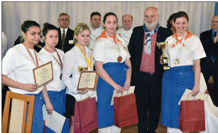
A győztes Lónyaysok

Ez az „elégséges tudásszint” nagyon komoly szakmai felkészültséget bizonyított. A vendéglátós diákok szakmai totó megoldásával kezdték elméleti tudásuk meg-