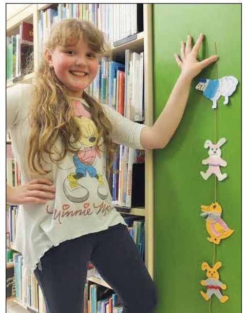
A Színfolt Alkotóköri húsvétra készült a Városi Könyvtárban