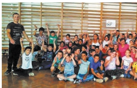
Táncos kedvű Vitkaiak

sányi református lelkipásztor volt, aki templomában évek óta rendkívül igényes, színvonalas műsorokat szervez, emellett aktív résztvevője a térség kulturális eseményeinek, és oszlopos tagja a vásárosnaményi amatőr szintársulatnak.