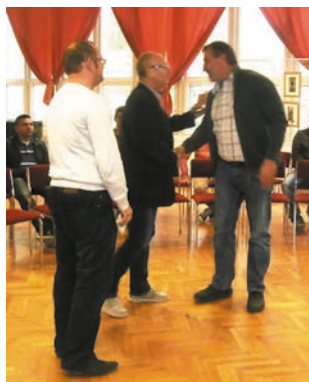
A „Bereg kultúrájáért” díj átadása