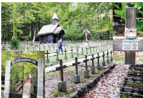
Katonatemető Szlovéniában, Bled térségében

A maradék tizenhárom fő – feltételezésem szerint – római katolikus és görög katolikus lehetett. (Erre nézve helytörténeti kutatást kellene végezni az egyházak levéltárában.) Elképzelhető az is, hogy a megismert tizenöt fő Vitkában született ugyan, de a háború idején már nem voltak vitkai lakosok!? Mind Ezekről függetlenül úgy gondoljuk, helye van mind az ötvennyolc fő nek az általunk összeállított vitkai hősök névsorában.